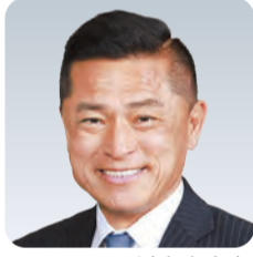
おおやね匠(自参無)