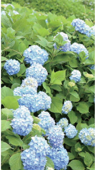
美しい花を咲かせる紫陽花 【旧中川水辺公園】

平成23年から、区議当選4回。建設委員長、医療・介護・高齢者支援特別委員長、議員選出監査委員等を歴任。