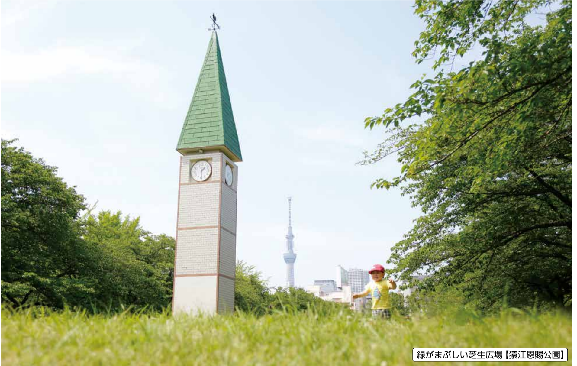
緑がまぶしい芝生広場【猿江恩賜公園】