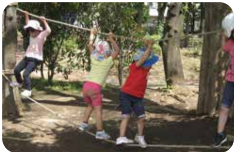
大島9丁目公園にプレーパーク整備を【池袋本町プレーパーク】

に制度導入を盛り込まなかった理由は。同制度を導入すべき。 答 制度導入を前提とした採択ではない。引き続き議論を深める。 問 制度導入に向け、自治体ネットワークに参加すべき。 答 議論のため参加予定はない。 問 計画策定等に当たっては、当事者を会議体に参加させるべき。 答 引き続き実態調査等を行う。 問 当事者等の居場所の設置を。 答 現状では設置の予定はない。 問 学校教育現場での理解促進を。 答 都の人権教育プログラムに基づいた学習等を行う。 (答弁 総務部長) こどもの育ちと遊び、こどもの権利について