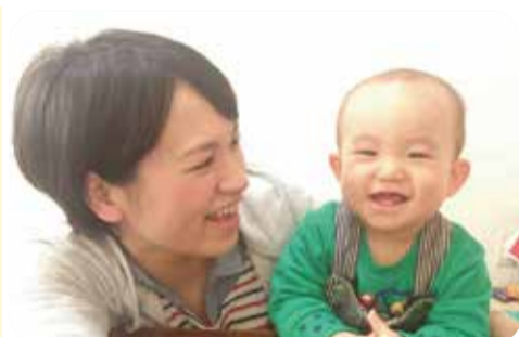
多様な保育ニーズに応えるべき【保護者と子】

外的子育て家庭を支援すべき。 答 財源や支援員の確保、ニーズの見極めなどの課題がある。 (答弁 子ども未来部長) 保育について 問 今年度の待機児童数は4名と大きく減少したが、これまでの保育所整備の実績は。 答 1年以降で163園を整備し、1万5799人の定員を確保してきた。 問 次年度以降の計画及び課題は。 答 長期計画等に基づき整備する。地域ごとの需要数に見合った整備を進めることが課題である。 問 安定的な保育所運営に向けて、賃借料補助期間の拡大の検討を。また、今後の支援の課題は。 答 引き続き当初の制度趣旨にのっとり運用する。継続的な財源の確保が課題である。 問 多様な保育ニーズに応えるため、ベビーシッター事業を導入すべき。 答 導入の予定はないが、今後の検討課題とする。 問 休日保育実施の進捗状況は。 答 来年開設予定の事業者から提案があり、検討を進めている。 (答弁 区長) 区民の生活環境について