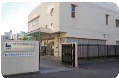
虐待の根絶に向け、多岐にわたる課題の解決を【大島子ども家庭支援センター】

問 大島子ども家庭支援センターで新たに始めるアウトリーチ型支援について、従来の虐待対応との違いは何か。 答 虐待予防の観点から、虐待に至る前に支援等を実施する点である。