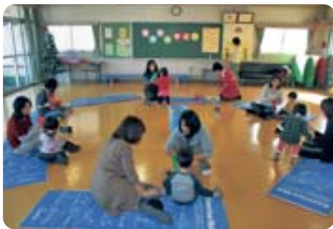
子育て支援のための活用も【児童館】

①若者の自立支援事業の効果は。②就労意欲が低い者への対策は。③企業・行政が一体となった就労支援を実施すべきではないか。④総合的な就業支援の拠点整備をすべきと考えるが区の見解は。 地域振興部長 ①2年間で57名を正規就労に導いた。②ハローワーク常設窓口を設置する。③検討していく。④検討していく。 ①子育て拠点としての活用を。②高齢者との交流の場づくりを。③大学生ボランティアによる学習の場としてはどうか。