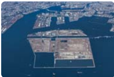
本区帰属の早期確定を【中央防波堤埋立地】

中で有効な選択肢であり、地域の総意の形成が重要と考える。【質問】中央防波堤利用について問う。