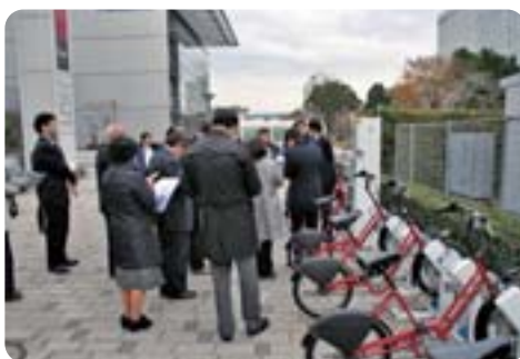
コミュニティサイクルステーションを視察【まちづくり・南北交通対策特別委員会】