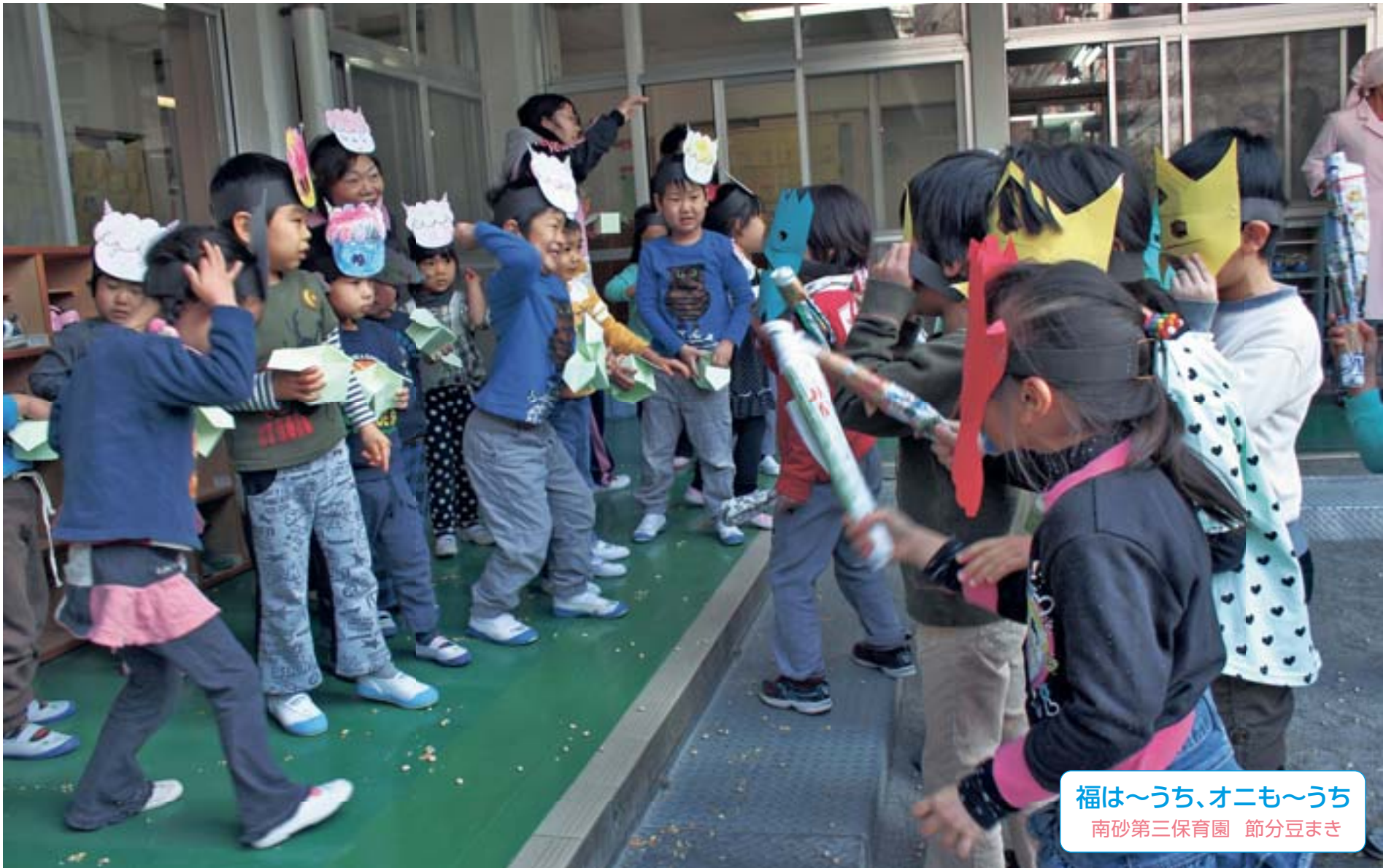
福は〜うち、オニも〜うち 南砂第三保育園 節分豆まき