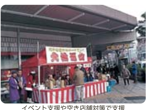
イベント支援や空き店舗対策で支援 【商店街イベント】

①本区の商店街、中小企業等の景気動向に対する認識はどうか。 ②商店街、中小企業等への来年度の経済支援策はどうか。 【質問】中央防波堤埋立地の帰属問題について問う。 ①本区と大田区の物理的な領有権以外の妥結点を様々な形で探る必要があるのではないかと。 ②帰属問題解決に向けて(ア)課題は。(イ)議会と共に行政は一致協力する必要があるが、議会への要望はどのようなものがあるか。 【区長】①東京オリンピック・パラリンピック開催までには確実に解決しなければならぬと考えており、領有権以外の観点も含めて早期解決に向けて全力で取り組んでいく。②(ア)過去に海苔の漁場があったことなどから大田区が帰属を主張し続けているが、静観しており積極的に解決する姿勢ではない。(イ)会派や議員個人として大田区や都への様々な繋がりを通じて、本区の帰属であると説得してほしい。