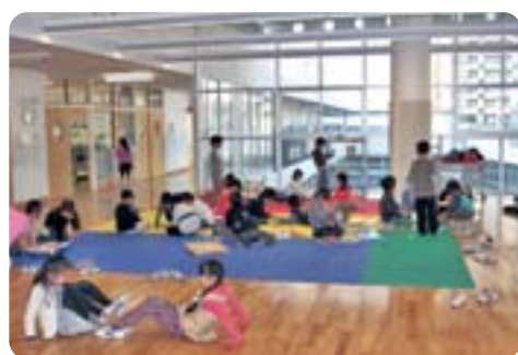
一層の効率的な事業と質の向上を目指す 【区内きずくクラブ】

区長 ①地域支援事業への移行後もNPO等と共に介護事業者も活用し、次期介護保険事業計画ではその実情を踏まえた体制整備を図る。②撤回を求める考えはない。③(ア)制度持続のため