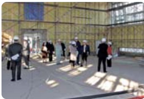
扇橋小学校改修工事を視察【文教委員会】