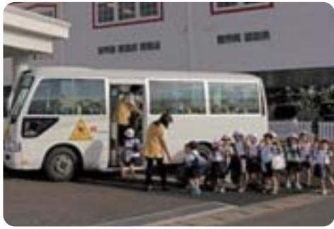
多彩な保育サービスの提供 【江東湾岸サテライト保育(イメージ)】

【区長】①認証保育所の施設長会を立ち上げ国の動向などの情報提供や認可外保育施設に意向調査を行っている。②江東湾岸サテライト保育の開設等、保護者ニーズを捉えた施策展開に取り組む。③(ア)予測は困難であるが、ニーズ調査や人口増加を反映した保育需要の予測に努める。(イ)こどもたちや保護者の視点に立ち、保育の質向上と多様な保育施設の整備計画を進めていく。