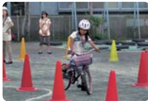
事故防止へルールとマナーを学ぶ 【小学生自転車安全教室】

【土木部長】①安全教室やキャンペーン等積極的に実施している。②違反抑止力はあるが、実施エリアが限定される等課題もある。③費用対効果の検証が必要であり、先駆的事業の状況を注視する。④PTAの協力の下に行っており、保護者の参加も呼びかけていく。⑤写真やイラストを活用し、分かり易く効果的な周知を図る。⑥豊洲に設置予定である。今後も国や都と連携してエリアを定める等整備を進める。