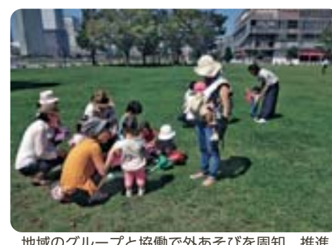
地域のグループと協働で外あそびを周知、推進 【子ども家庭支援センター・ひろば事業】

に向けた家庭訪問型支援サービス協働事業の現状と今後の展望は。 ③子育てしやすい環境と虐待の未然防止の観点から産後ケア・産後ヘルプ拡充を進めるべき。 ④こどもの成長に必要な外遊びに繋げる施策の展開が必要では。