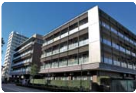
特別養護老人ホームの入所基準見直し 【区内特別養護老人ホーム】

には応能負担はやむを得ない。(イ)求める考えはない。④見直しや引き上げを求める考えはない。