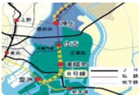
南北交通の利便性向上の早期実現を 【地下鉄8号線(豊洲-住吉間)の延伸】

区長 ①(ア)合同訓練実施へ展開する。(イ)地域の自主的な取組みを啓発する。(ウ)開設・運営関係者による検討を始める。(エ)実施