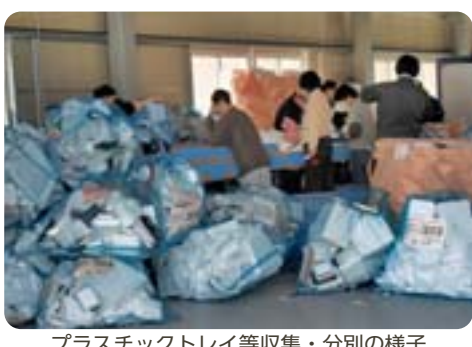
プラスチックトレイ等収集・分別の様子 【エコミラ江東】

【区長】①最終処分場の延命効果はあるが、資源化の更なる取組みが課題である。②(ア)問題はなすと認識している。(イ)負担公平の観点からごみの減量・資源化の推進に努める。③(ア)拡大生産者責任の強化や容器包装の発生