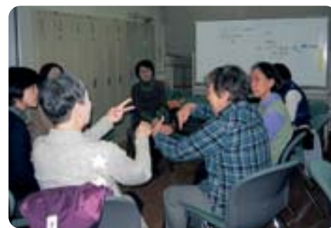
情報の円滑な取得等を支援【区内手話サークル】

の有無に関わらない共生社会の実現を目指し、教育環境の整備・充実に努めていく。(ウ)学校選択制度はない分、保護者との信頼関係を築き、継続的相談により、より良い就学へ繋げる。