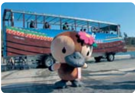
区のブランド力向上に役 【江東区観光キャラクターコトミちゃん】

②外部人材の登用や研修で職員の広報力強化を図るべきでは。 ③SNS等の区の公式アカウント開設等情報発信力の強化を。 ④キャラクターの活用について(ア)各事業別のキャラクターを集約し、戦略的に活用しているのか。(イ)区のキャラクターをコトミちゃんに一本化してはどうか。(ウ)コトミちゃんを区のPR活動に繋がる商品販売等、戦略的に活用するべきではないか。 ⑤ご当地ナンバー導入について(ア)区の見解は。(イ)区民要望の把握等今後の方向性は。(ウ)他区の単独申請について区の見解は。