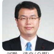
河野 清史 (公明)