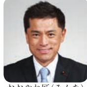
おおやね 匠 (みんな)