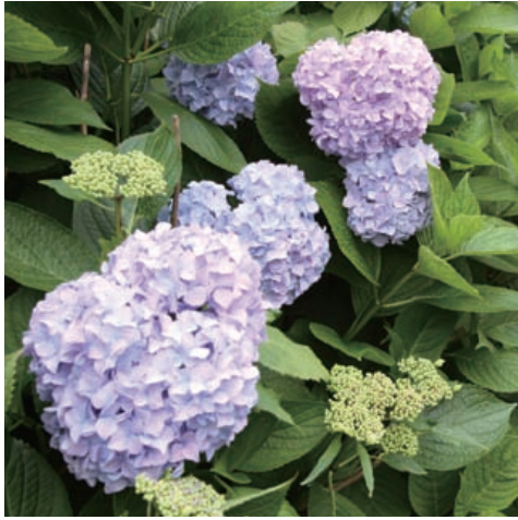
梅雨時の公園を彩るあじさい (古石場川親水公園)

議長略歴 自民 52歳 平成7年から、区議当選5回。文教委員長、議会運営委員長、議員選出監査委員等を歴任。議長は2回目。