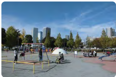
こども主体の公園利用の推進を【公園で遊ぶこども】

の努力を学ぶべきである。(イ)こども達が国際社会で活躍する上で重要であり、要綱等に基づき適正・公正に審議している。④各学校が通学路の道路事情等を考慮して実施を決定するものである。⑤他者の迷惑になる遊び方は禁じており、関係部署と連携しつつ、体力向上に努める。