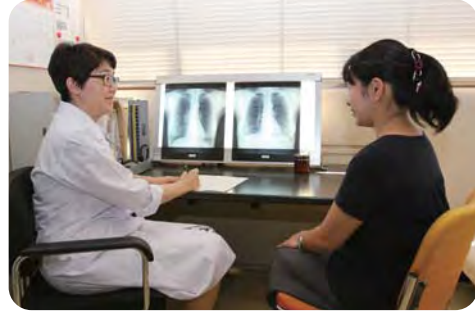
がん対策は、予防・早期発見・早期治療【がんの医療相談の様子】

し、がん予防に取り組む。③検討していく。④リーフレット等の活用により、今後も普及・啓発に取り組む。⑤在宅医療相談窓口とがん相談支援センター等の連携により、ニーズにあった相談支援の充実を図っていく。