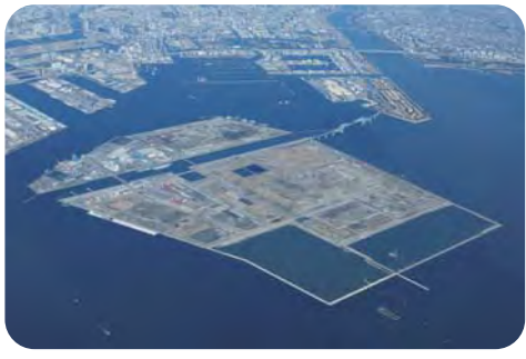
中央防波堤埋立地帰属の早期実現を【中央防波堤埋立地】