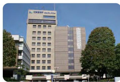
区民の視点に立った情報発信を【江東区役所】

土木部長 ①交通安全教室等を継続的に実施する。②今年度中に方針を策定する。③合同点検を実施し、継続的に効果の把握・検証等を実施する。