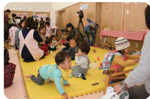
在宅で子育てをしている家庭を応援する取組み【マイ保育園ひろばフェスティバル】

② 効果的・効率的な指導や検査の実施のため、都区の一層の連携を図る。② 民間委託により保育の質が低下するとは考えていない。③ 保育需要への素早い対応には民間活力の活用が重要である。④ 高い利便性と待機児童解消効果から、見直しは考えていない。⑤ 処遇改善は区長会を通じて求めており、家賃助成は先進事例等の調査を行う。