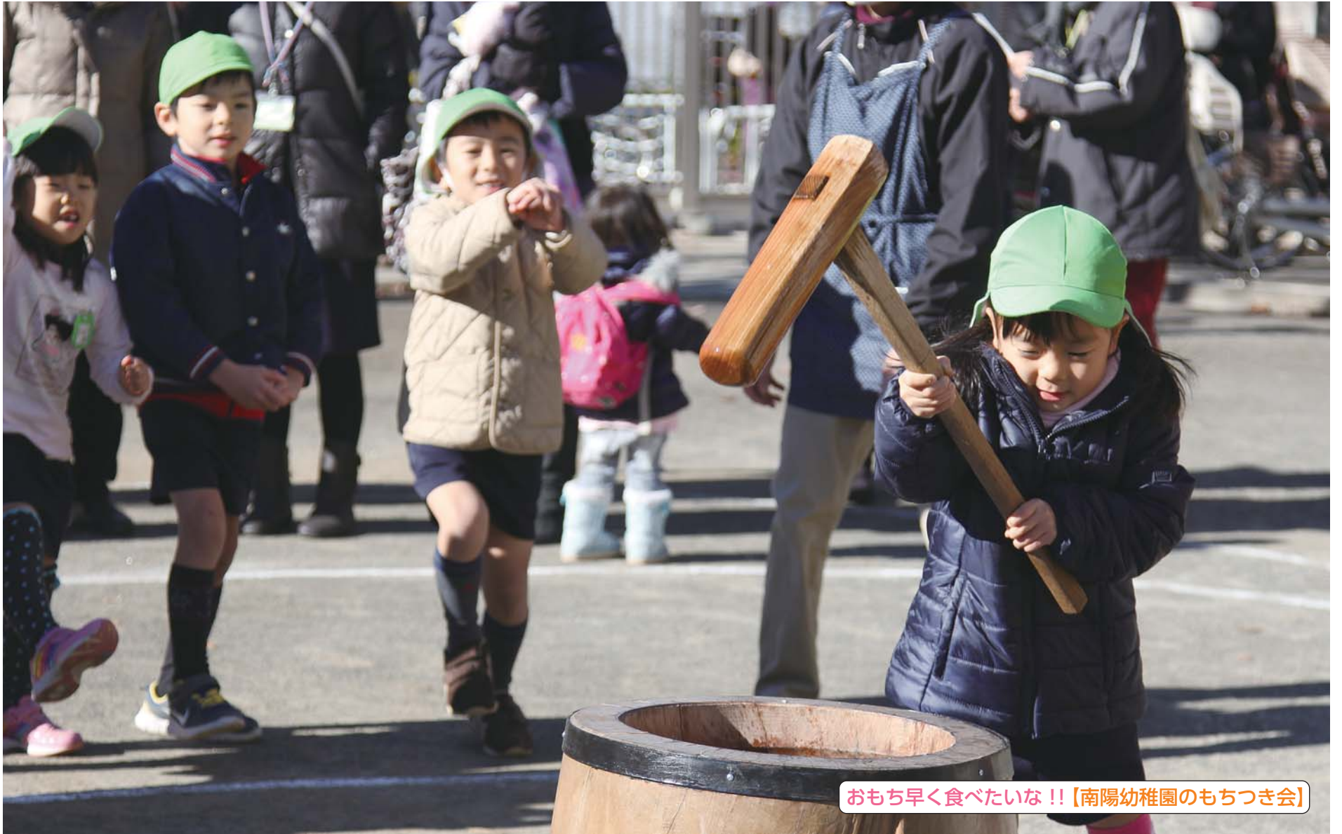
おもち早く食べたいな!!【南陽幼稚園のもちつき会】