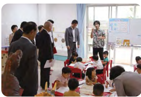
江東湾岸サテライトスマートナーサリースクールを視察【厚生委員会】