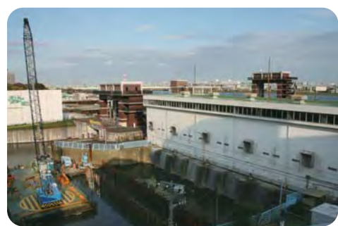
水害から区民を守る耐震・耐水対策を【工事中の小名木川排水機場】

【土木部長】 ①27年末からの約5年間は排水能力が通常の半分程度で、時間雨量50ミリ以下でも水位が上昇する。都は豪雨でも既設護岸を越流せず、沿川市街地に危険はないとしている。②パトロールと水位監視の強化の実施が重要であると考えている。