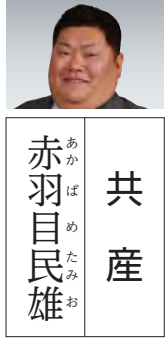
共産 赤羽 目 民 雄