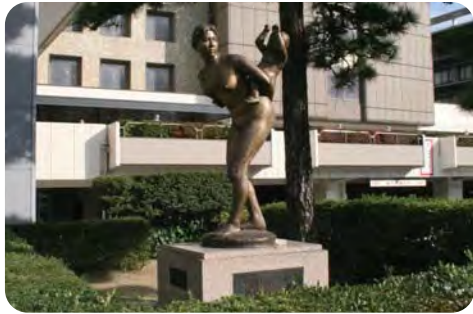
背負っている子が成長した時も平和な日々であることを願う【母子像「希い」】

⑤ 保育士の更なる処遇改善を国や都に求めるとともに、家賃助成の実施により保育士確保を。