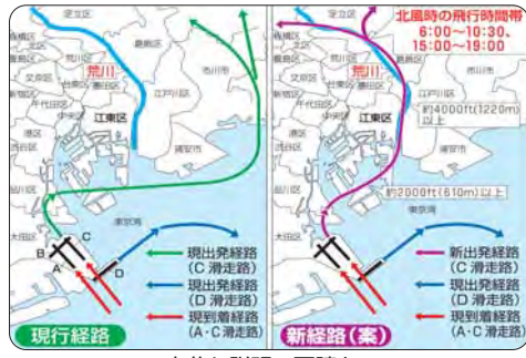
十分な説明の要請を 【荒川上空飛行計画に関する飛行経路図】

【質問】 地域振興部長 ①国の成長戦略の効果が、中小企業に及ぶにはまだ時間を要すると考える。②現時点での実施は考えてない。(イ)今後検討していく。③現時点で実施する考えはない。