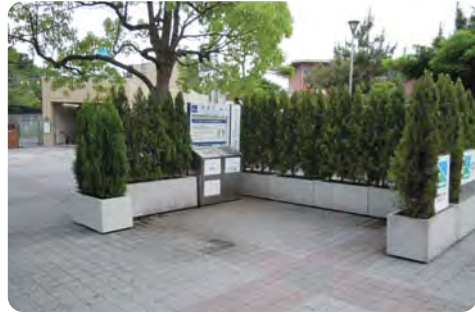
適切な場所への移設を【辰巳駅西口の喫煙所】

べき。(イ)煙の拡散防止のため、パーティションを設置すべき。 ②辰巳駅西口周辺に視覚障害者用点字ブロックを設置すべき。 ③東雲地区を含む湾岸エリアに交番を新設し、治安対策強化を。 ④不燃化特区の地区拡大を。 ⑤若者と女性の就労支援を充実すべきだが、今後の施策展開は。