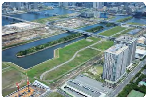
約一万二千人の客席数を有する有明操縦競技場建設予定地【有明北地区】

〔質問〕2020年東京オリンピック・パラリンピック開催に向けた地域整備を問う。 ①臨海部に本区が主導で優先的に防犯カメラを整備すべきでは。 ②競技場周辺や観光客の動線上等において公衆便所の多目的化をすることともに新設の検討を。 ③臨海部のオフィスビル等での植栽の取組みと緑化整備もレガシーの一つとするべきでは。 〔質問〕新公会計制度の導入について問う。 ①新公会計制度の導入に対する本区の認識はどうか。 ②財務書類作成システムについて検討状況はどうか。 ③財務書類等の作成によるメリットをどう活用するのか。 政策経営部長 ①区民への説明責任や効果的・効率的な財政運営の促進を図る重要な手段と考える。②様々な事業者のシステムを十分検討し選定していく。③詳細な財務状況を把握・分析し、公共施設マネジメント等に有効活用していく。