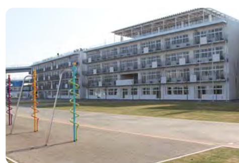
施設一体型連携教育 【有明小・中学校】

【質問】 区長 ①(A)育児休業取得者を除く数値を実質的待機児童数として公表している。(イ)1,200名程度であり、うち育児休業取得者は約200名である。(ウ)乳幼児人口の増加と、保育需要の掘り起こしが主な原因で、様々な手段・手法により、解消していく。②運用方法の見直しは慎重な対応が必要と考える。③保育士の処遇改善、キャリアアップ補助等、新たな補助制度で保育士の確保、定着に努める。