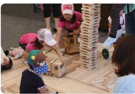
木を活用した子育て環境の整備を 【木のおもちゃで遊ぶ子ども】

【質問】 区長 ①木材利用方針に従った施設整備に努める。②本区の方角性と一致するため、連携できる条件を整えば、地場産業活性化の立場から検討する。③木育は「えここくる江東」にふさわしく、国産ヒノキのボールプールや「つむ木」などを活用する。