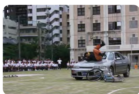
スタントマンによる交通事故再現【自転車安全教室】

区長 ①(ア)的確な区政運営が実現できた。(イ)インターネットの普及等の変化を捉え推進に努める。(ウ)行政需要増大等による差額の縮小を見込む。②(ア)業務委託による効率化等を進めた。(イ)