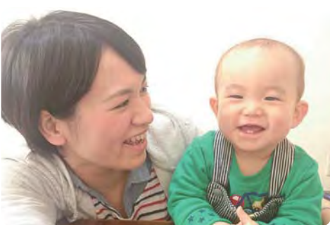
産後ケアへの充実を【母子の様子】

(質問)本区の産後ケアを問う。①産後ケアの必要性への見解は。②専門性を持ったサポーター養成への積極的な取り組みを。③産後入院とデイケアの充実及び補助制度への見解はどうか。