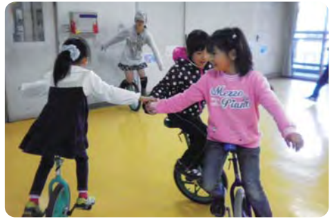
放課後の居場所づくり【児童館】