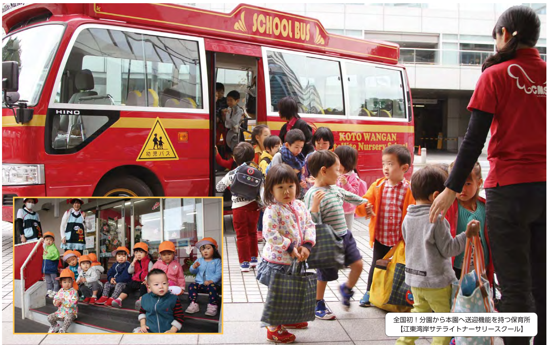
全国初！分園から本園へ送迎機能を持つ保育所 【江東湾岸サテライトナーサリースクール】