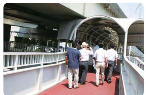
塩浜二丁目交差点を視察【建設委員会】