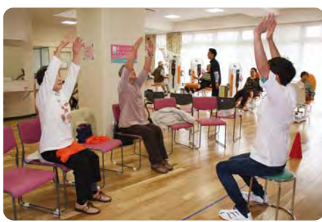
健康維持・増進への取組み【あかつき苑・健康増進スペース】