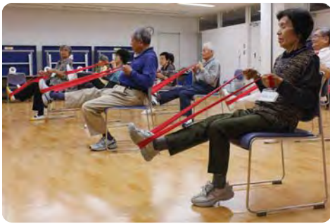
介護予防プログラム【深川北スポーツセンター】

①介護保険制度の改正について(ア)今後の対応はどうか。(イ)制度の見直しを求めるべき。②介護保険料の負担軽減を。③都の新たな支援策を活用し特別養護老人ホームの増設を。④地域包括支援センターの充実について(ア)業務状況に対する認識はどうか。(イ)機能の拡充を。