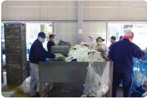
NPO法人との協働による障がい者への就労支援【エコミラ江東】

(ア)直接の支援は困難であるが、観光案内冊子への掲載で利用促進に繋げる。(イ)現段階では算定できないが、シンガポールではカジノ税と入浴税で800億円超の税収があった。③行政サービス向上等に必要と考えるが今後検討する。④様々な角度から検証しあり方について検討する。 【質問】障がい者施策を問う。 ①障がい者への就労支援の現状と今後の課題はなにか。 ②手帳を持たない軽度知的障がい者への支援が必要と考えるが区はどう考えているのか。