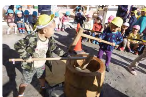
もちつき大会【区立保育園】

(エ)学童保育への有資格者の配置を現行通り2名配置すべき。 ②待機児童対策について(ア)問題ある保育事業者の実態を調査し改善を求めていくべき。(イ)都用地活用制度を活用し、区立認可保育園の増設を図るべき。