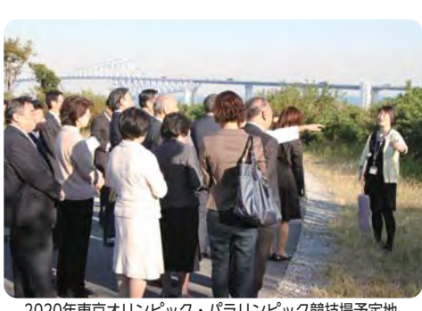
2020年東京オリンピック・パラリンピック競技場予定地

2020年に開催される東京オリンピック・パラリンピックでは、本区に多くの競技場が設置される予定です。江東区議会では10月29日、夢の島、若洲、有明など区内会場予定地を視察しました。