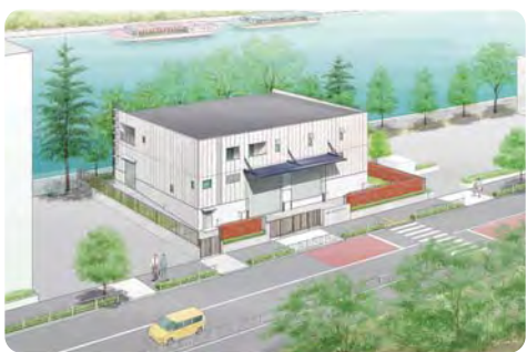
応急物資等の機能を持つターミナル型防災倉庫【江東区中央防災倉庫】

区長 ①予防的避難の方策等を検討していく。②中央防災倉庫の整備により円滑な物資供給体制の確保を図る。③学校避難所運営協力本部連絡会により地域の主体性の醸成を図っていく。