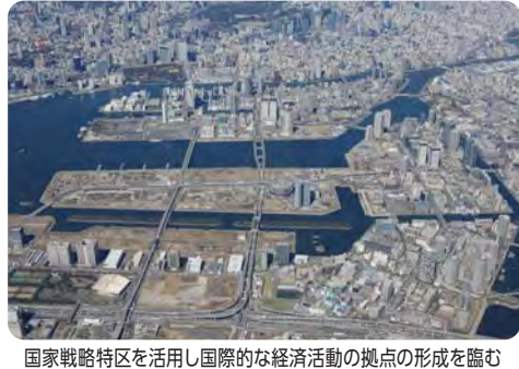
国家戦略特区を活用し国際的な経済活動の拠点の形成を臨む【臨海部】

【区長】①区域計画において必要な規制の特例措置等が盛り込まれるよう、都等と連携すると共に、庁内の検討委員会を活用し必要な方策を検討する。②国際観光の拠点化が見込まれる臨海部に整備することで、高い相乗効果が期待でき、