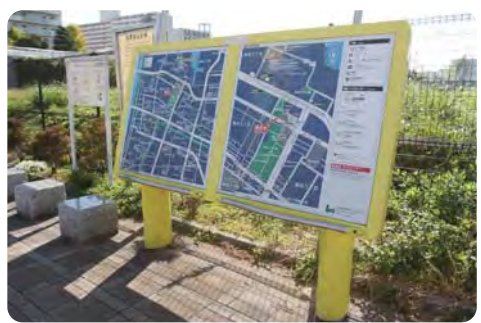
やさしいまちの誘導システム【ユニバーサルデザインを用いた案内図】

【子育て世帯や高齢者が社会参加しやすいまちづくりについて(ア)ベビーカーマークを周知すべき。(イ)ゆとりシグナルの推進を。(ウ)心のバリアフリーへの見解は。