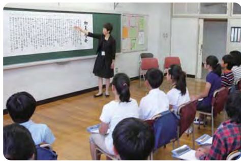
言語力・表現力の伸長と感性を磨く優しい心の育成【俳句の授業】

教育長 ①(ア)目標値を達成し、実を結んだと認識する。(イ)きめ細かい設定を検討している。(ウ)心の成長に繋がる実践に取組む。(エ)幼児期から運動に慣れ親しむ取組みを進める。(オ)授業改善に