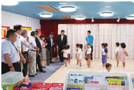
江東湾岸サテライトナーサリースクールを視察【厚生委員会】