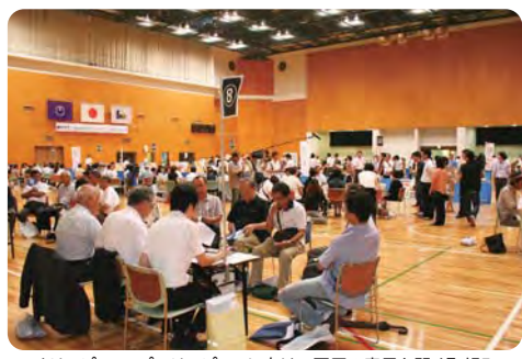
オリンピック・パラリンピックに向けて区民の意見を聞く取組み【東京五輪関連イベントの様子】

③江東湾岸エリアにおけるオリンピック・パラリンピックまちづくり基本計画の取組み方針は、消費税免税制度の活用方法は、体験型・交流型の要素を取り入れた着地型観光を企画しては、美術館等で会議を開催するユニークベンチャー推進への考えは、