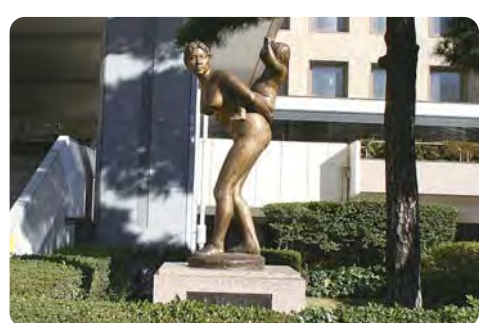
背負っている子が成長した時も平和な日々であることを願う【母子像】

【質問】総務部長 ①趣旨普及に一定の効果があり、被災70周年行事を計画している。②講話など様々な取組みを行い、平和に関する教育の充実に努める。