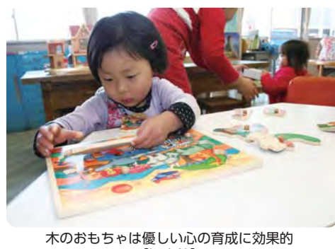
木のおもちゃは優しい心の育成に効果的【児童館】