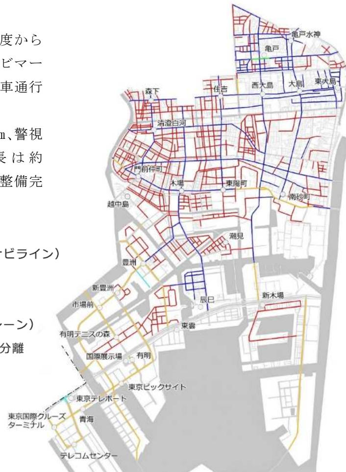
図 区内自転車通行空間の整備形態別整備状況図 (令和 4 年 3 月末時点) 国道・都道・警視庁施工含む