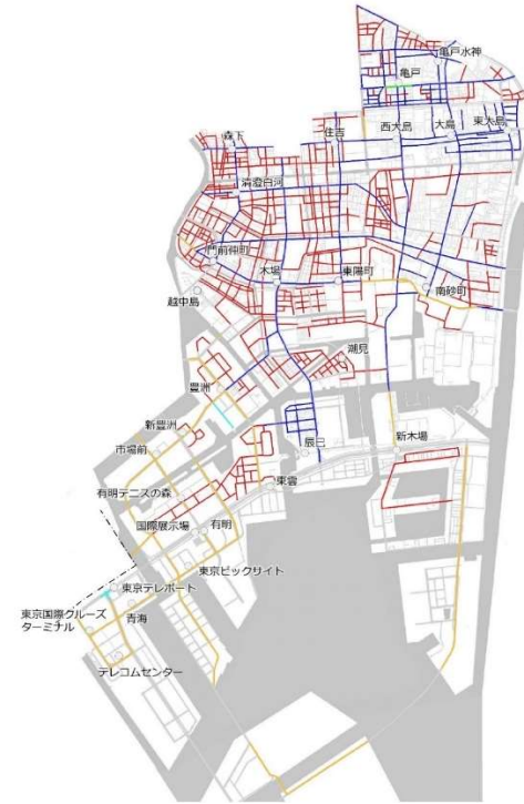
図 区内自転車通行空間の整備形態別整備状況図 (令和 4 年 3 月末時点) 国道・都道・警視庁施工含む