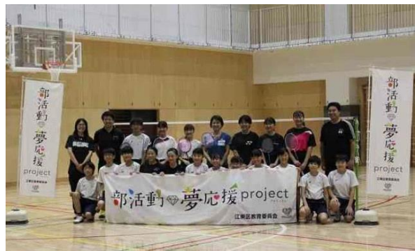
&lt;部活動☆夢応援プロジェクト&gt;