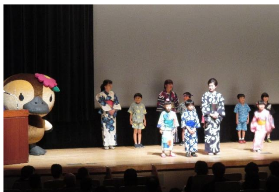
<東京五輪音頭 2020 の様子>