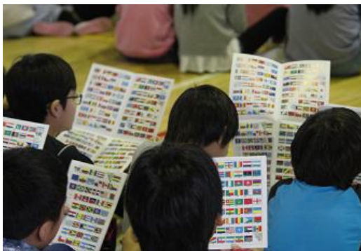
&lt;世界の国旗・国歌について学ぼう&gt;