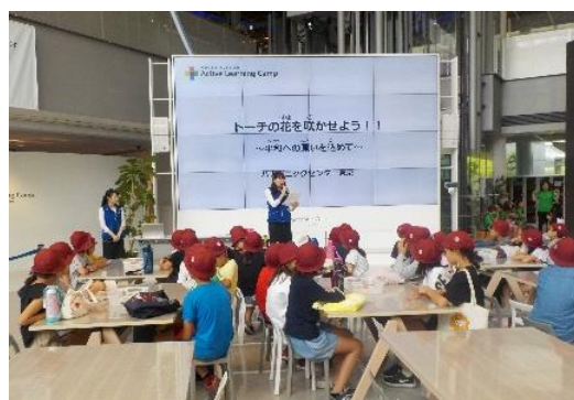
&lt;江東区にオリンピック・パラリンピックがやってくる&gt;