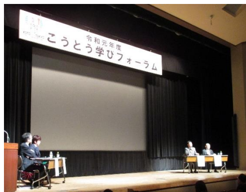
<パネルディスカッションの様子>