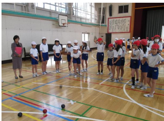
<ボッチャ体験の様子>