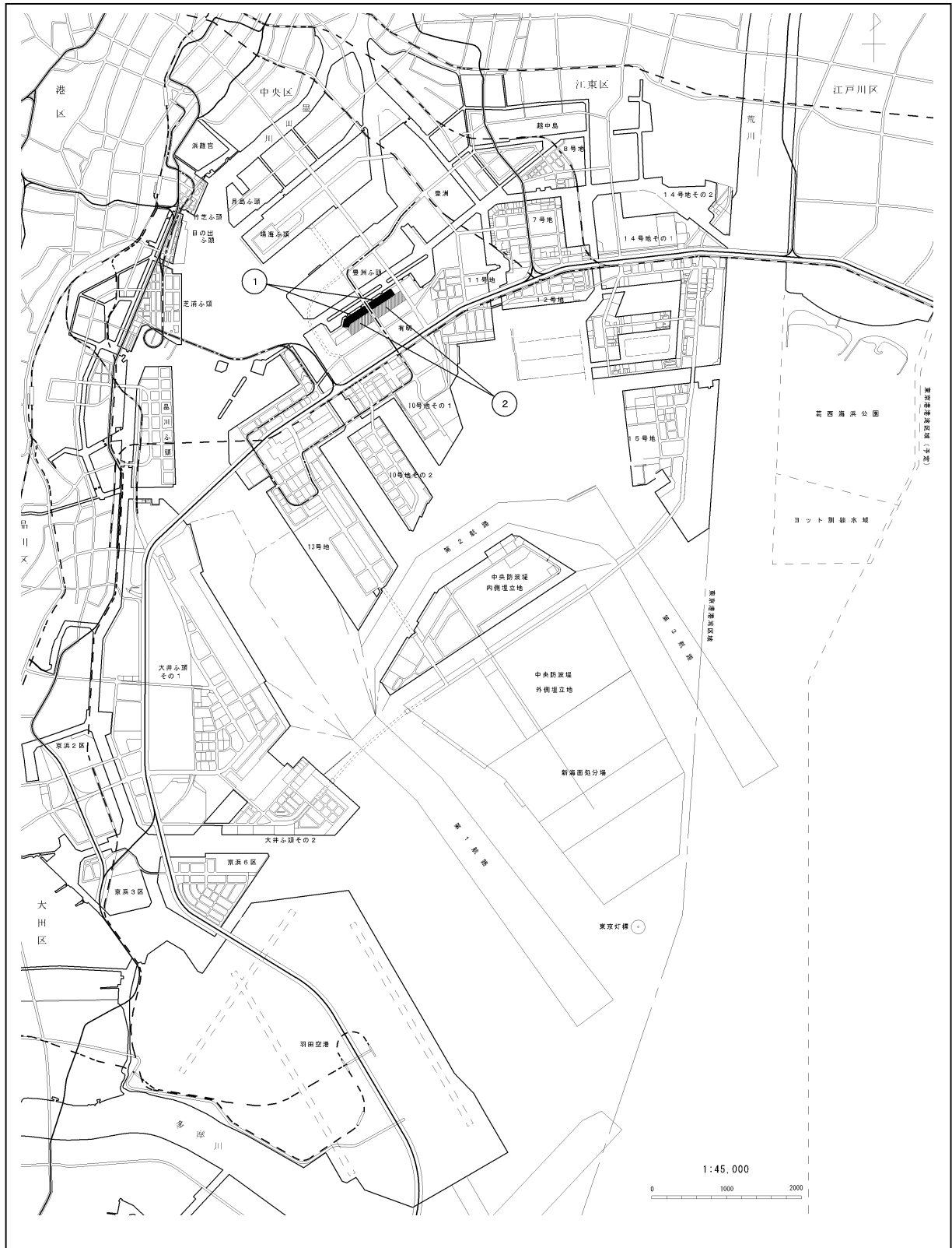
図中①～②は変更箇所を示す