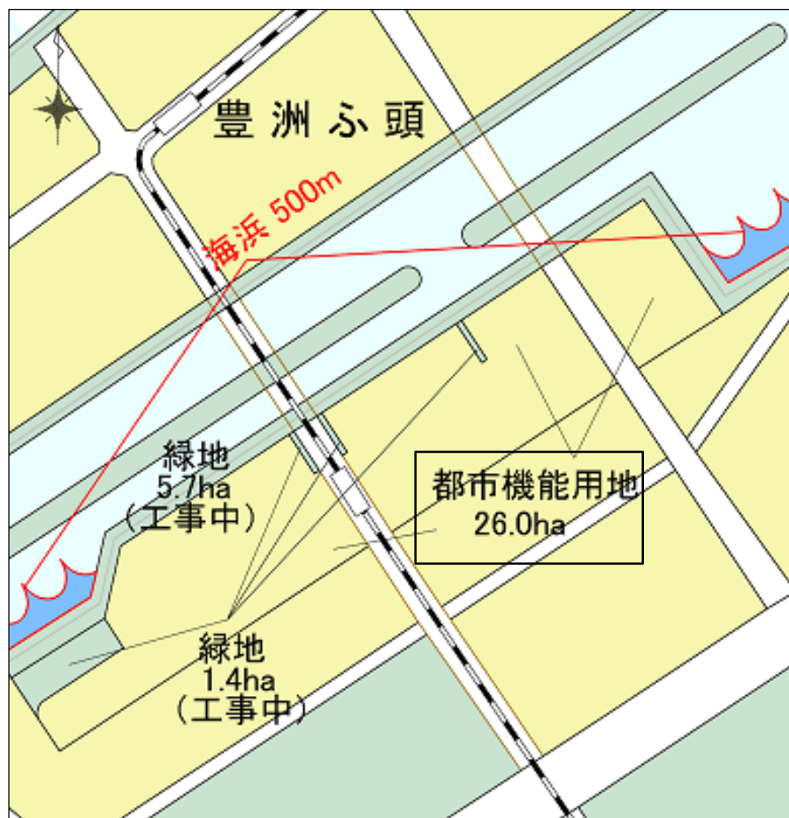
[計画説明図（既定計画）]