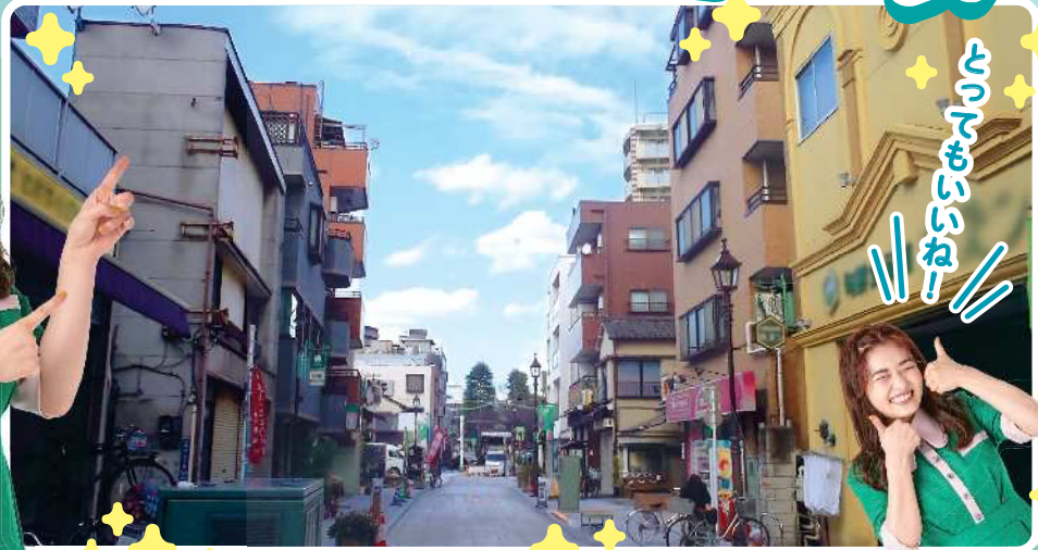
※東京都江東区(区道電戸3丁目地区)無電柱化取組事例