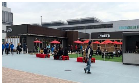
■「江戸前場下町」外観