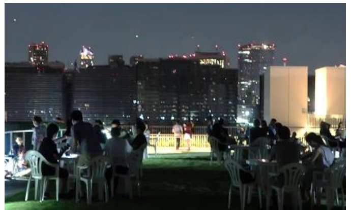
■夕涼み・夜景観賞イベントの様子（8/10）