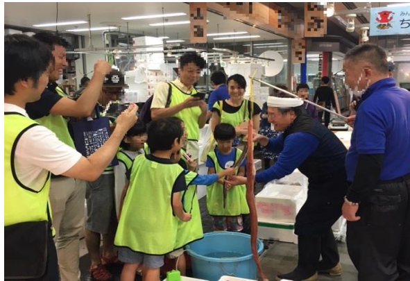
■親子見学ツアーの様子（8/31）

地元区をはじめとする都内在住の小学生と保護者25組50名（うち江東区10組20名）を対象に、水産・青果の仲卸売場などの業務施設や屋上緑化広場などの見学会を実施