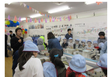
模型展示イベントの様子