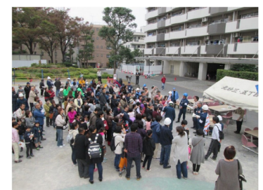
合同防災訓練の様子