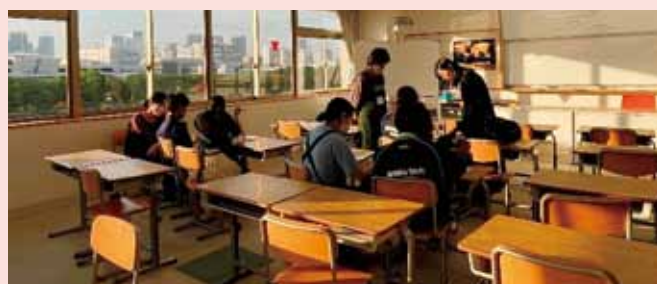
英検合格に向けた自習・対策教室を実施!