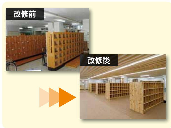
☎ 学校施設課施設計画係 TEL(3647)8543 FAX(3647)8547

便、ご迷惑をおかけいたしますが、良好な教育環境確保や地域の防災機能向上のために学校施設の改築、改修を計画的に実施してまいりますので、引き続きご理解ご協力のほどお願いいたします。