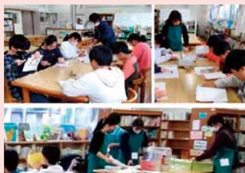
図書委員会の活動をサポートしています!