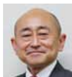
教育長 本多 健一朗