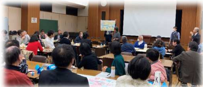
▲グループごとのまとめを発表！