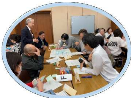
▲積極的に意見を出し合います！