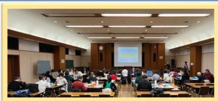
▲参加者全員に向けてお話いただきました。