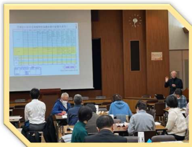
▲活動のヒントがたくさんありました！