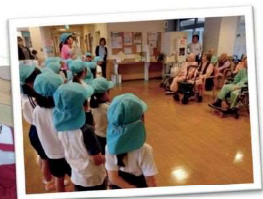
近隣の高齢者施設を訪問します