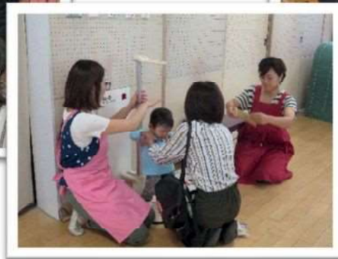
先輩ママが子育ての相談にのってくれます