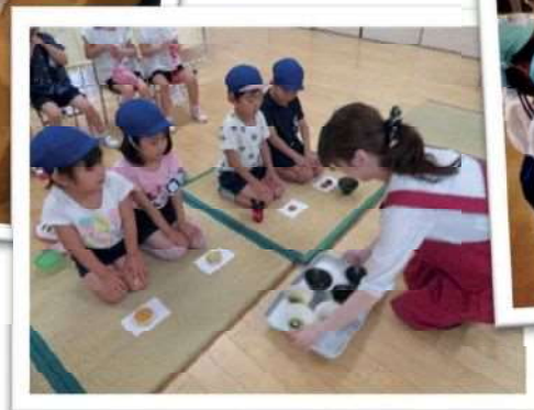
ボランティアのお母さんと 楽しい時間を過ごします