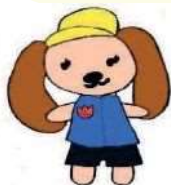
三大のさんちゃん