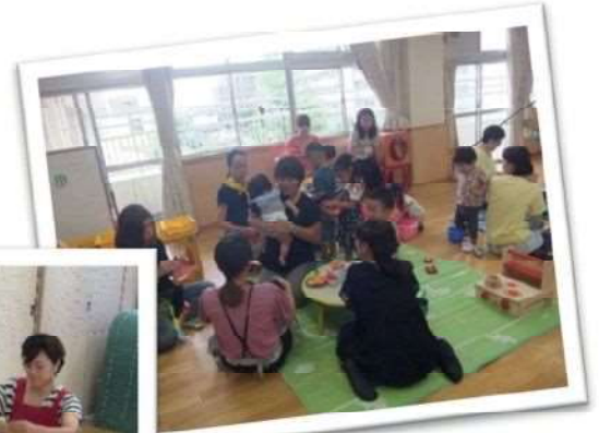
同年齢の友達ができます