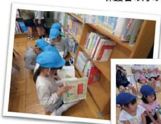
図書館で本を借りるなど 地域にも出かけます

在園の方に対するサービスで、月に1~2回程度、無料で 通常の教育時間より長くお子さんをお預かりします。 保護者の方のリフレッシュタイムとなっています。