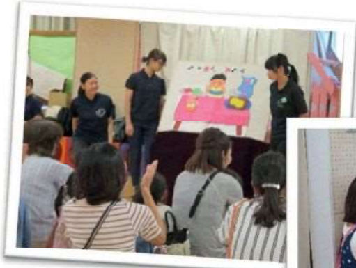
楽しい活動がたくさんあります

地域の未就園児親子の皆さんに幼稚園の施設を開放しています。 開催日時は各園のHPをご覧ください。