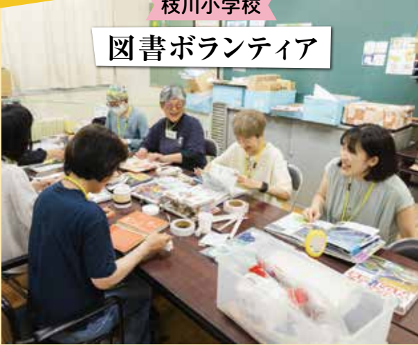
本の修理も楽しんでいます!