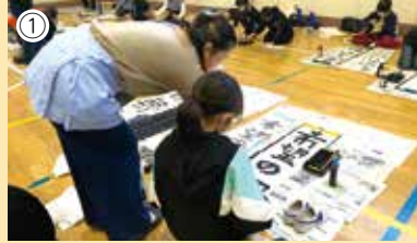
席書会(①)・授業(②)・遠足のサポートや卒業式の飾りつけ等の活動もあるんだよ。