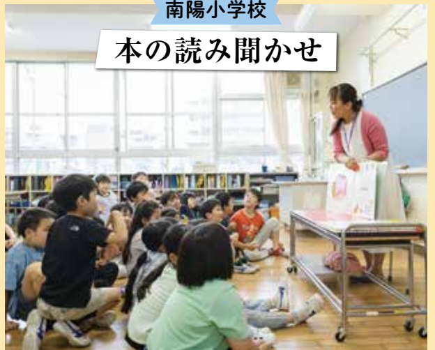
みんな真剣に聞いています