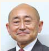
教育長 本多 健一郎