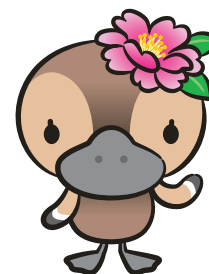
江東区観光キャラクター コトミちゃん