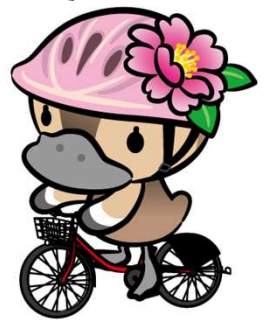
江東区観光キャラクター コトミちゃん