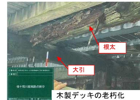
木製デッキの老朽化