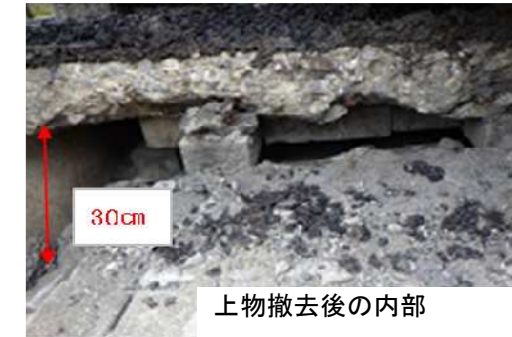
上物撤去後の内部