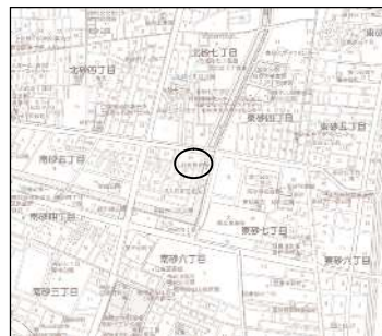
砂町魚釣場（南砂5-24先）

砂町・豊住両魚釣場では、料金の安い工業用水を利用して運営してまいりましたが、令和4年度末にて工業用水が廃止となることとなりました。加えて、施設の老朽化等もあり、砂町・豊住両魚釣場は、永きにわたりご愛顧をいただいているところですが、 令和4年12月28日（水） をもって閉鎖することといたしました。