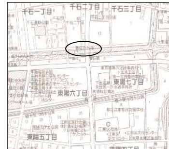
豊住魚釣場（千石2-1先）