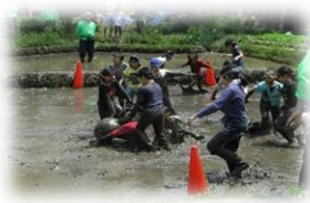
どろんこオリンピック