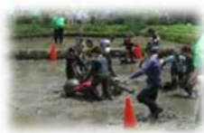
どろんこオリンピック