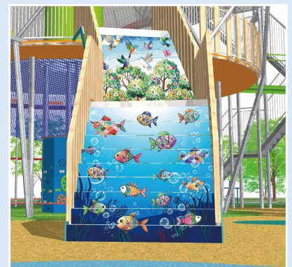
キッズアート階段の完成！