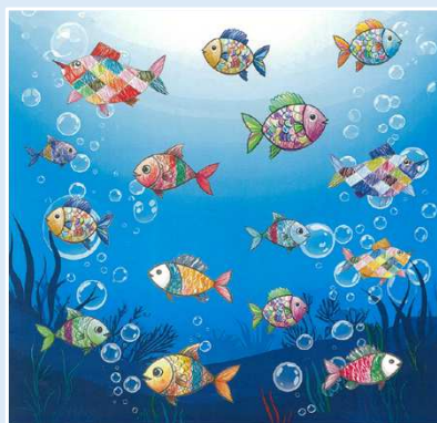
描いてもらったイラストを 配置・加工