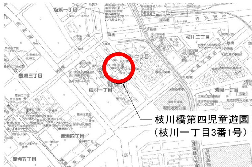
枝川橋第四児童遊園 (枝川一丁目3番1号)