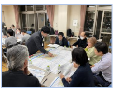
▲第4回までの具体的なアイデア等を踏まえ、各班でゾーン等を検討しました