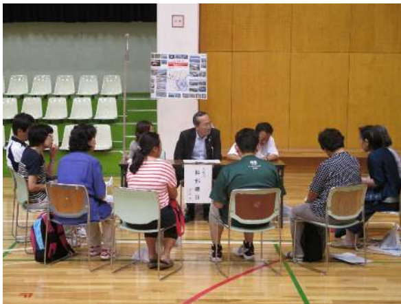
意見ヒアリングイメージ

会場受付にて、延伸に関連する「夢」（このような施設ができればよいな）などをシールに記載し、該当する地域に貼り付ける。