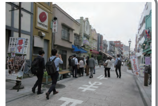
無電柱化された商店街の様子

江東区内の無電柱化の事例として、亀戸香取勝運商店街を視察しました。無電柱化したことによる景観の向上だけでなく、地上機器の大きさの体感や点検口など無電柱化に必要な機器を確認することができました。