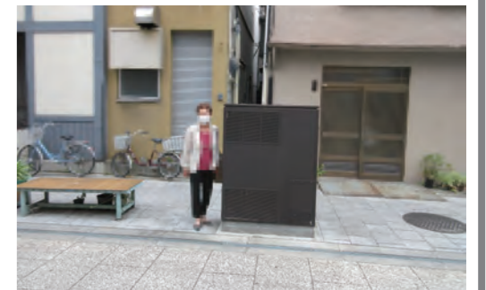
地上機器の大きさの体感