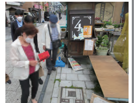
点検口を確認する様子