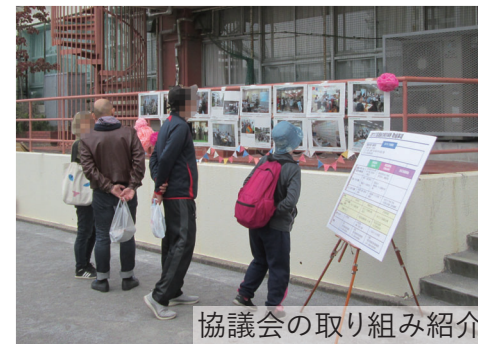
協議会の取り組み紹介