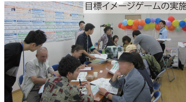
目標イメージゲームの実施