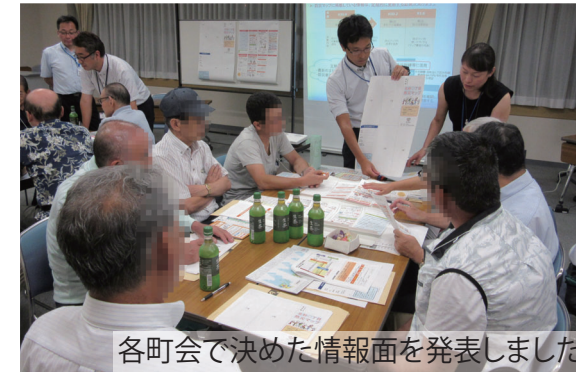
各町会で決めた情報面を発表しました