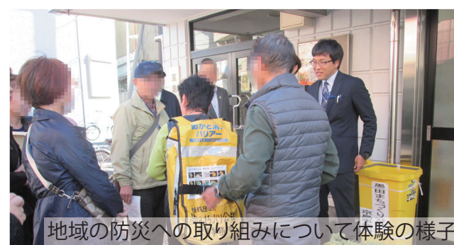
地域の防災への取組みについて体験の様子