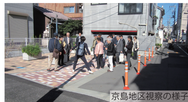
京島地区視察の様子