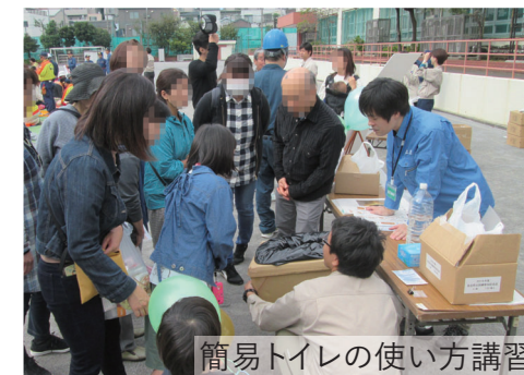
簡易トイレの使い方講習