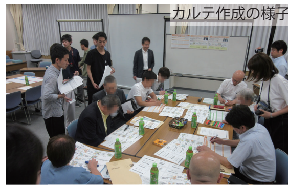
カルテ作成の様子

まちづくり模型展示イベント2の開催に向けて、イベントで行うクイズラリーの内容を考え、砂町銀座商店街の将来像をイメージする目標イメージカルテを作成しました。