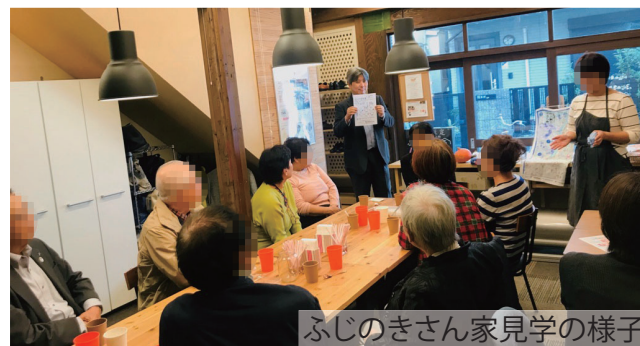
ふじのきさん家見学の様子

ふじのきさん家のホームページはこちら↓ http://fujinokisanchi.com/