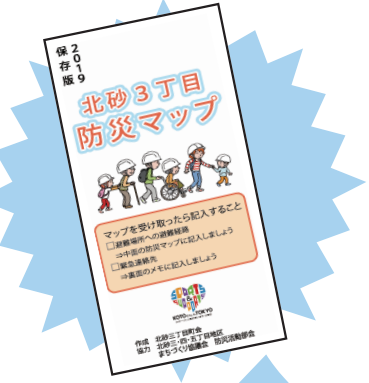
マップを開くと防災に役立つ情報が掲載されています!

昨年度に作成した各町会の防災マップについて、各町会でそれぞれマップの表面に掲載したい情報を話し合いました。マップに掲載している情報は、今後各町会での自主的な更新を目指します。