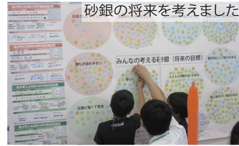
砂銀の将来を考えました