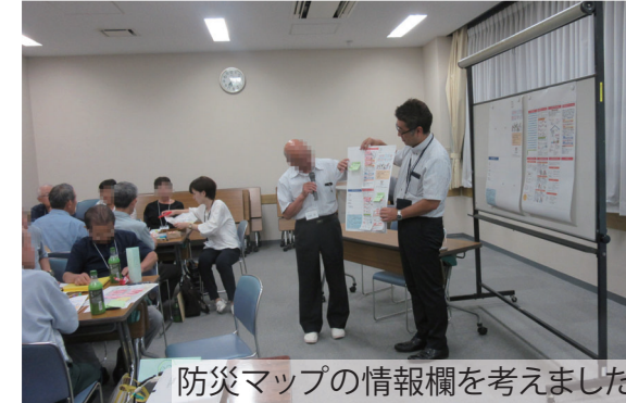
防災マップの情報欄を考えました