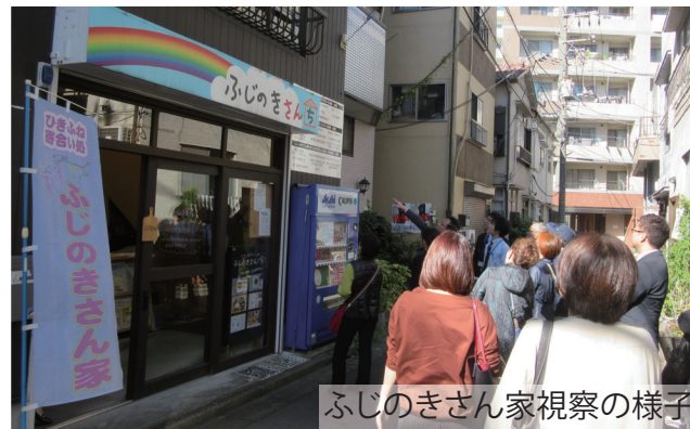
ふじのきさん家視察の様子

「ふじのきさん家」は、地域の寄合い処としてだけではなく、「防火・耐震化改修のモデルルーム」としての役割も担っています。