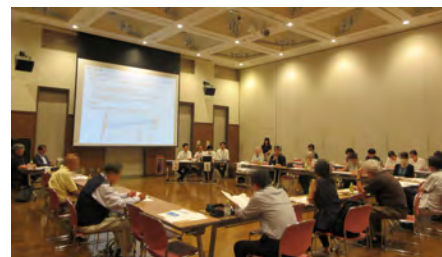
第19回まちづくり協議会の様子

まちづくり提案書にある「空地活用」「地区計画」「無電柱化」「商店街が地域と連携して定めるルール」の4項目について、江東区から今年度の取組み内容の説明がありました。