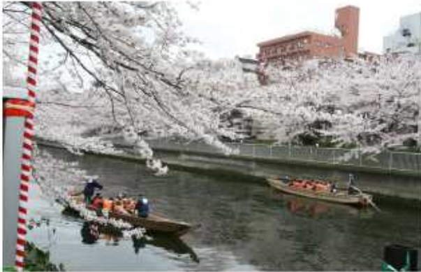
深川さくらまつり(大横川)

豊洲地区から伝統と文化が色濃く残る深川の拠点である門前仲町までのエリアを総合的に捉え、合同のイベントを実施したり、船での観光客の輸送などを企画する。