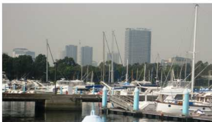
夢の島ヨットハーバーから豊洲方面を臨む