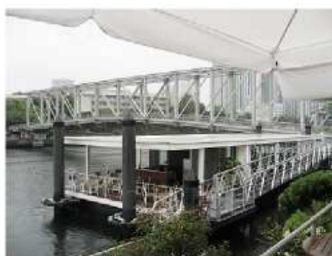
運河との親水性を高めるオープンカフェのイメージ