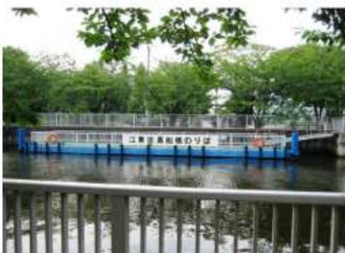
門前仲町駅近くの既設の水上バスステーション

江東区内には、7箇所の水上バスステーションがあり、また、新たにこの豊洲地区においても船着場を設置する予定となっている。これらの水上バスステーションとの連携を図りながら、地域の特性を考慮した新たな舟運等の検討するよう働きかける。