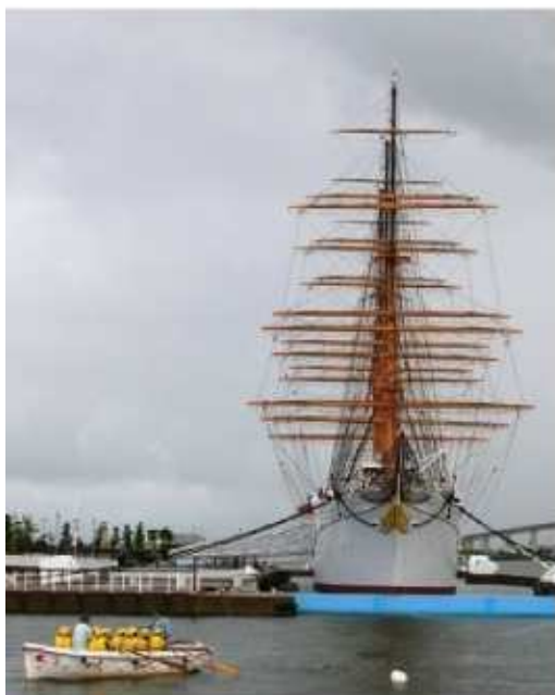
大学との連携活動のイメージ

江東区と学校法人芝浦工業大学、国立大学法人東京海洋大学は、教育、文化、産業、まちづくり等の分野において協力することにより、相互発展と活力ある地域づくりを図り、もって区民福祉の向上に寄与することを目的として、平成19年11月に包括協定を締結した。東京海洋大学には船着場がある他、ボートの実習等を実施しており、芝浦工業大学でも運河クルーズを実施するなど、両大学と運河との関わりは大きい。