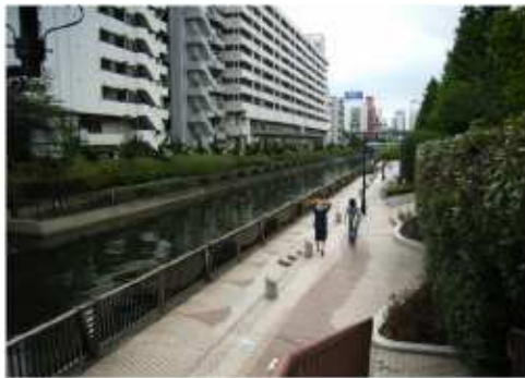
運河沿いの遊歩道のイメージ

地区内の開発により多種多様な建築物が建設されており、住居系の建築物には多くの居住者が入居し、業務系の建築物には多くの企業が入居している。このため、地域住民や地域企業の参画のもと、親水プロムナード側やプロムナードに結びつく区間において、新築や改修の建物の際は景観調和をはかるよう関係機関等に働きかけていく。また沿道の緑化等の調査・研究を推進するよう関係機関等に働きかけていく。