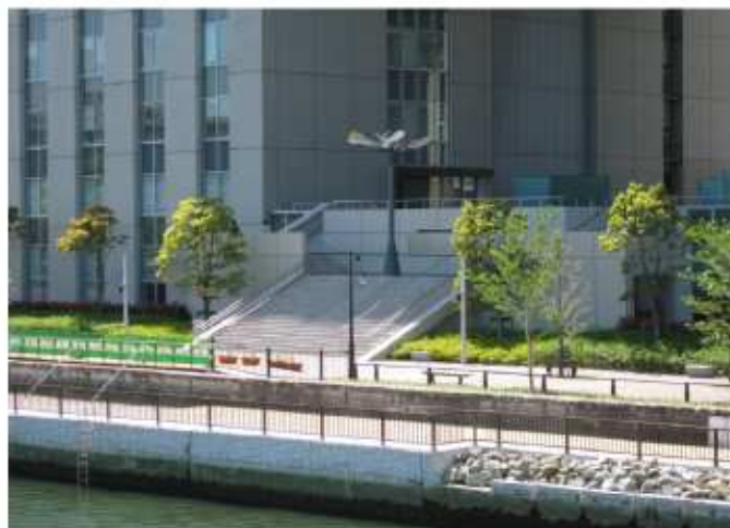
隣接建物との一体的な整備(芝浦工業大学前)