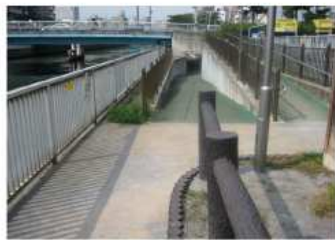
回遊性の確保イメージ