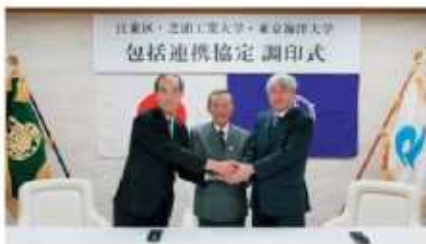
江東区と大学の包括連携協定調印式の様子 (平成19年11月)

大規模な再開発により新たな住民や企業が増加する一方で、古くからこの地域に住む住民や既存の地域組織、大学も存在することから、様々な人と組織が連携し、イベント等を通し一体となったまちづくり、地域おこしを推進していく。