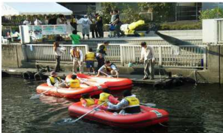
水辺に親しむ体験のイメージ