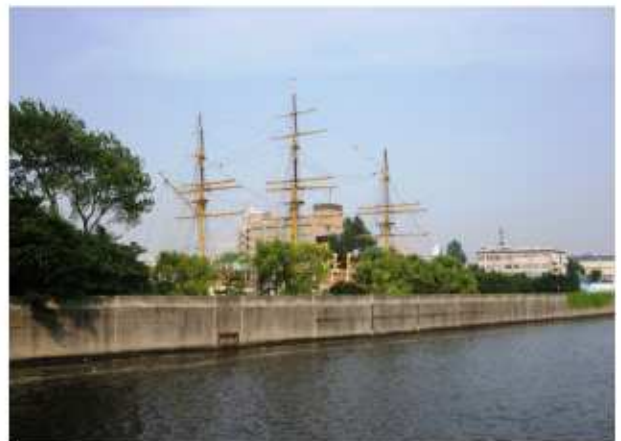
隅田川からみた東京海洋大学と国指定重要文化財明治丸

豊洲地区の周辺では、今後も豊洲埠頭、有明、東雲、潮見、越中島地区等でも大規模なまちづくりが行われる。これらの地区においても、運河ルネサンス導入にあたっては積極的に協力する。河川区域内のまちづくり時においても、水辺を活かしたまちづくりを積極的に推進し、豊洲地区との連携を働きかける。