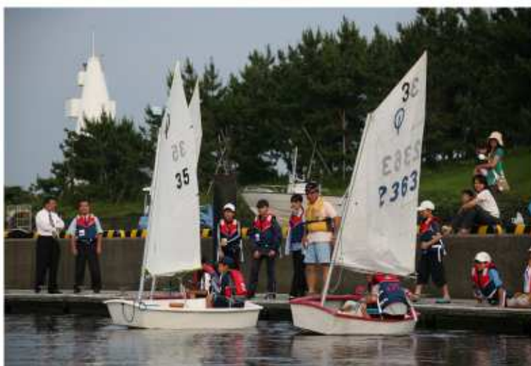
江東区セーリング部活動(豊洲北小学校が拠点校)

このような状況の中、若い世帯が多く、子どもたちが多数いる豊洲地区の特徴を活かして、小学校や保育園等の水辺に関する活動行事等との連携により、次世代を担う子どもたちが水辺に親しめるようにする。一方で、運河ルネサンスの活動においても、子どもたちに魅力のある活動を企画し、「子どもたちの参加＝親の参加」を図り、良好な地域コミュニティの形成を推進していく。