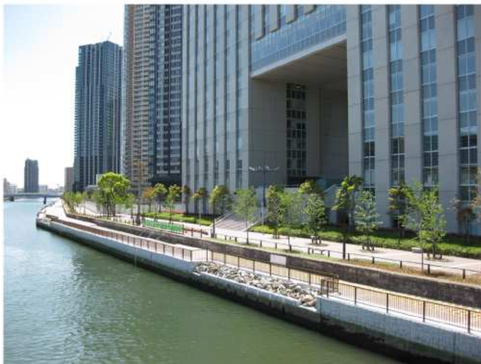
芝浦工業大学との連携した活動の拠点づくり

これら地元大学との連携による具体的な取り組みの一つとして、オープンカフェなど新たな親水空間を創出するとともに、かに引越し作戦・水質浄化実験など環境対策等の様々な研究・実験フィールドとして運河を大学等が活用できるようにする。