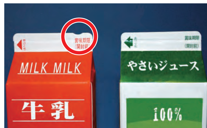
上に切りこみがあるのが牛乳の印