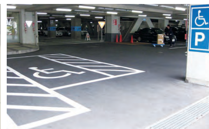
横のスペースが広いちゆう車場