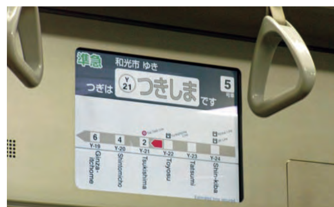
電車の中の音声と表示情報