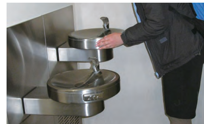
高さのちがう水飲み場