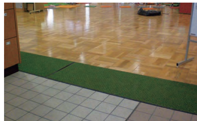
だん差のない入口