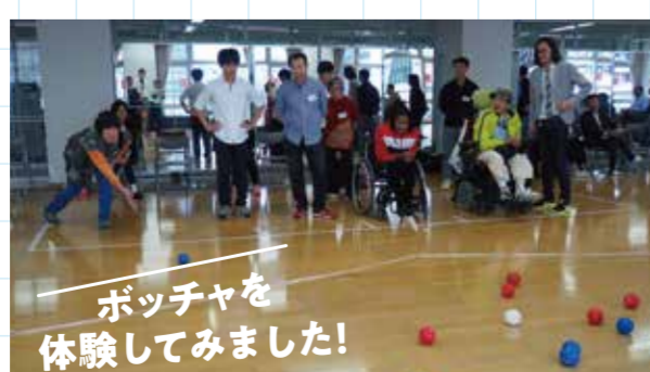
ポッチャを体験してみました! 車いす使用者、視覚障害者、聴覚障害者、外国人も参加。3対3の団体戦形式で実施。視覚障害者にはジャックボールがある場所から手をたたいて、投げる方向を知らせました。

江東区では区民と区が協働で「ユニバーサルデザインまちづくりワークショップ」を行い、まちづくりを進めています。このマップも、このワークショップの中で検討しました。