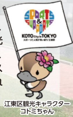
江東区観光キャラクター コトミちゃん

このマップは、このまちに来た人が楽しみ、だれもが使いやすいことをめざした観光マップです。地元の人のおススメ情報、様々な立場の人で点検したまちのアクセス情報を掲載しています。このマップはこれからも更新していく予定です。