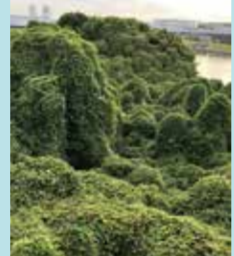
かつては波からまちを守っていました。今は緑豊かな空間に。