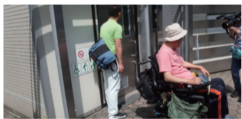
駅前にあるロケット館(多機能トイレ)