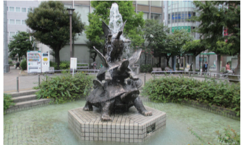
駅前モニュメント「はねかめ」