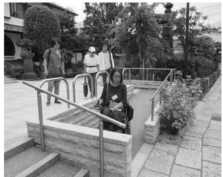
車いすでもスロープで墓参り可