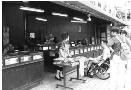
昔ながらの風情を残す店