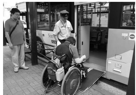
車いすでバスに乗車