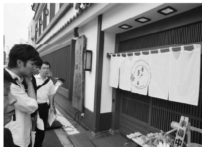
老舗の和食屋は車いすでも入れる