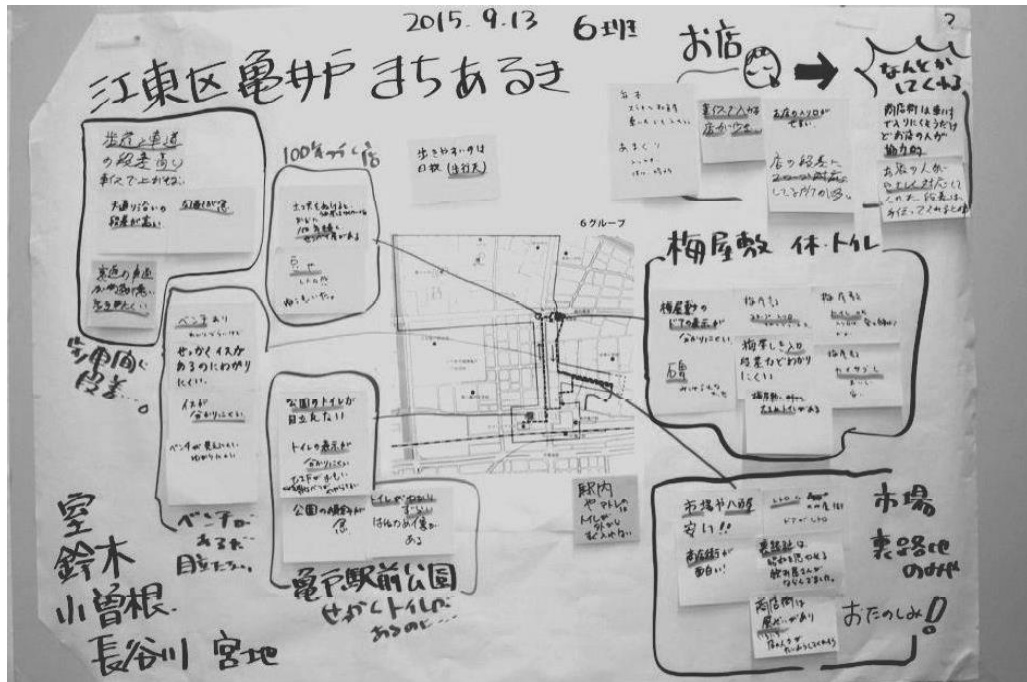
グループ毎に行ったまとめ作業（一部掲載）