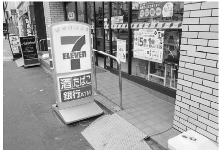
コンビニ前の簡易スロープ