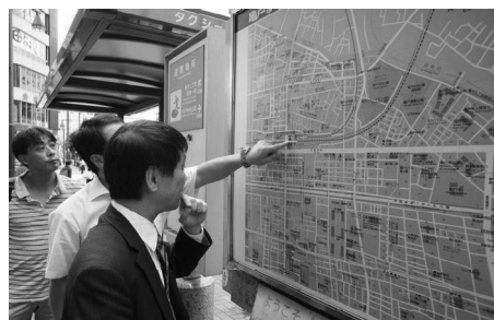
弱視の人は近づいてサインを確認