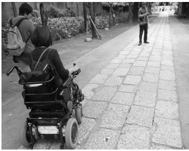
香取神社の参道の石畳