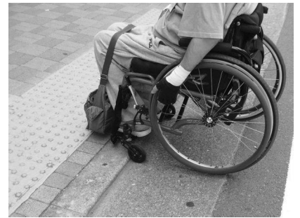
小さな段差もあがれるかを確認