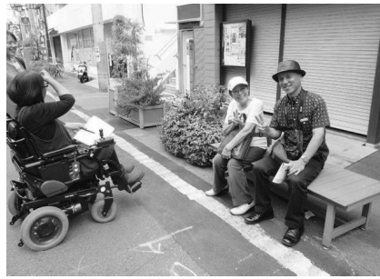
商店街にあるベンチで一休み