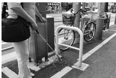
歩道上にある車止め