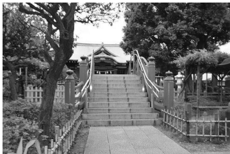
亀戸天神内の車いすアクセスは限られる