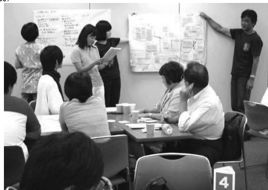
どんなことに気づいたか、グループごとに発表