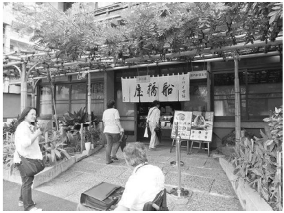
車いすでも入りやすい老舗船橋屋