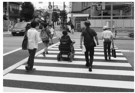
横断歩道を渡る時間も十分か確認