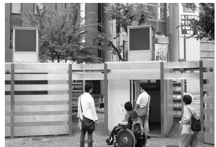
駅前広場にあるトイレもチェック