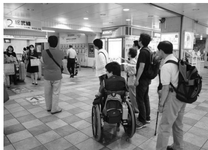
亀戸駅のアクセス状況を確認