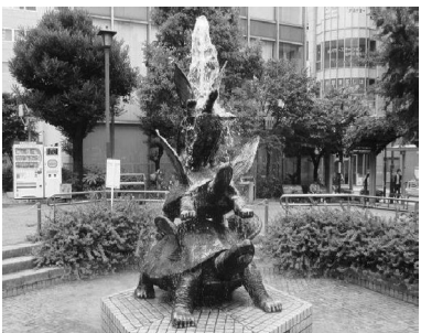
亀戸駅前のシンボル「はねかめ」