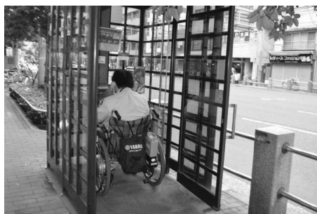
車いすで入れる電話 BOX