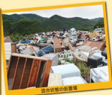
混合状態の仮置場