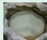
破砕・選別したガラス