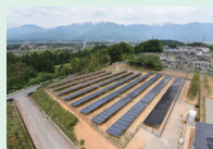
リユース品を使用した発電所