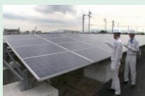
太陽発電設備の検査の様子

使用済みとなった太陽光パネルには、再販売可能なものもあり、既に多くのリユース事例が報告されています。