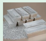
有用金属(銀)のイメージ