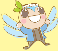
えこくる江東 たすけくん