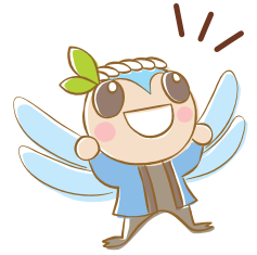
えこっくる江東 たすけくん