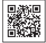
Nakasaad sa kanang itaas ng vaccination voucher

Sistema ng pagtanggap ng reserbasyon para sa pagbabakuna ng COVID-19 ng Koto City https://v-yoyaku.jp/131083-koto