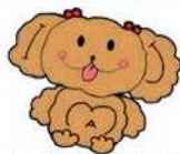
大島児童館のキャラクター「ショコラ」

大島七丁目団地の1階、カラフルなのぼり旗が「やってるよ!」の目印です。乳幼児専用の「遊戯室」のほか、卓球や一輪車ができる「集会室」、マンガやぬりえ、パズルなどで遊べる「図書室」、イベントルームの「わくわくランド」があり、赤ちゃんから小学生・中高生世代まで楽しむことができます。