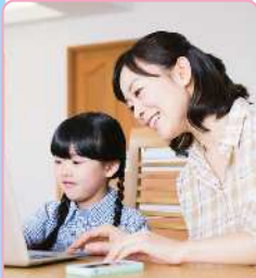
きょうだいのお世話