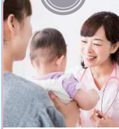
健診や買い物等の 外出同行