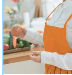
食事の支度 片付け