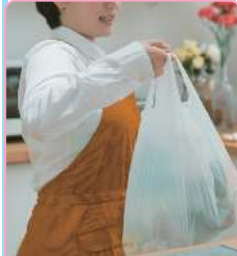
生活用品の 買い物