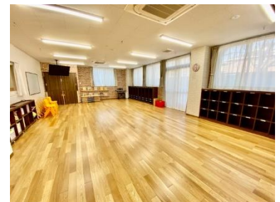
ゆったりと過ごせる広い休日用保育室