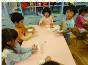
年長が折り紙をおしえているところ