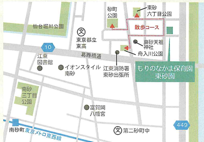
【最寄り駅】東京メトロ東西線/南砂町駅 徒歩18分

■実施を予定している子育て支援事業：行事体験、子育て支援相談、 地域福祉施設(高齢者)との交流