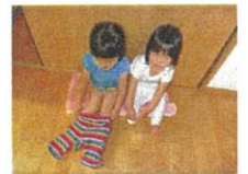
3～5歳児 年齢にあった「チャレンジ」を目標に就学に向け自立する力を身につけていきます