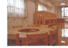
木の手作り家具に囲まれた、量もあるお部屋で、安心してゆったりと過ごせる環境作りを目指しています