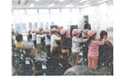
高齢者(近隣のケアセンターとの交流)

なかよし保育(3～5歳児の混合グループで縦割りのペアを組んで活動、運動会では力を合わせバレー競技)