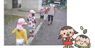
プールの時期と雨の日以外は毎日全クラスが近隣の公園へ出かけます。幼児クラスになるとマラソンで荒川の河川敷まで出かけることもあります。