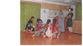
お泊り保育(5歳児が両親と一晩離れ「立派な忍者」を目指し修行します)