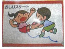
運動カード(すべての神経系の発達を促す運動が描かれたカード)

①運動あそび 専門の指導員が、体育ではなく『運動あそび』として独自のプログラムで、スポーツを「好きになり」、「楽しみ」、「続けていく」心を育てています。さまざまな運動や遊びを経験し、バランス感覚、リズム感、器用さ、言語能力、運動能力の発育、発達を助け、その指導を園内の活動に活かし、積み重ねていくことで、子どもたちのケガも減ってきました。