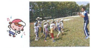
リズム体操(緩急をつけた動きと瞬時に周囲の情報を捉える動き)