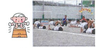
運動会(各クラスがテーマを持ち取り組み、5歳児のくみだて体操は感動です)