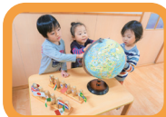
地球儀から世界の 国々を探しています