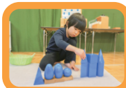
立体の側面を見て 同じ形を探しています