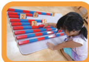
数の概念を学びます