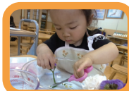
花の水切り 花瓶にかざります

1907年、イタリア初の女性医学博士マリア・モンテッソーリは、子どもの姿を観察し、「子どもは手を使いたがっていること。子どもの意志で選んだ活動は、生きる力をすべて注いで何度も集中して取り組むこと。繰り返し行うことにより集中力と自立心を養いながら、子ども自身で自分の心“人格”を育てていること」を発見しました。モンテッソーリ教育は、この0歳～6歳までの発達の目覚ましい時期に、人格形成の土台となる感覚的な機能(五感=視・聴・触・味・嗅)を十分に使うことを最も基本的な課題としている教育です。