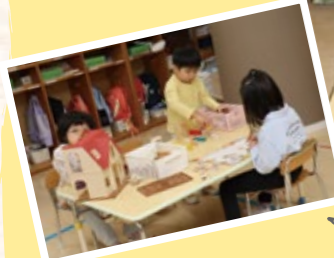
運動会や発表会は一段と 気合いが入ります！

私は、高校生の時に進学先を決めるため、地元の短大のオープンキャンパスに行って、幼児教育、心理学の模擬講義を受けました。受講後には、幼児教育についてもっと学んでみたいという思いと目標ができ、最終的に保育士の職に就くことを決断しました。