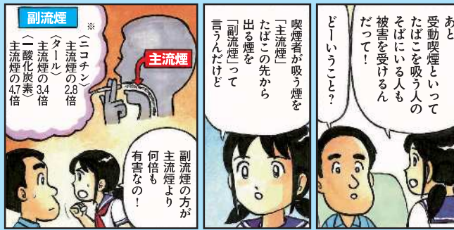
※厚生労働省HP「最新たばこ情報」より