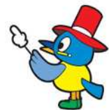
江東区民まつりキャラクター