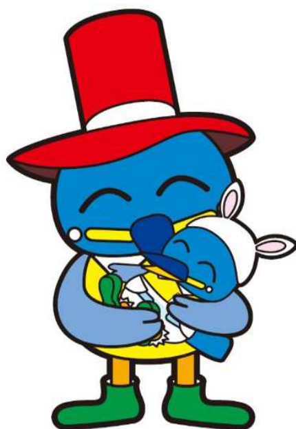
江東区民まつりキャラクター コトットちゃん

児童福祉法に基づく通所支援事業（児童発達支援・放課後等デイサービス・保育 所等訪問支援・医療型児童発達支援）の区内事業所の概要を紹介する冊子です。 事業所の受入状況や詳しい情報は、直接事業所へお問い合わせください。