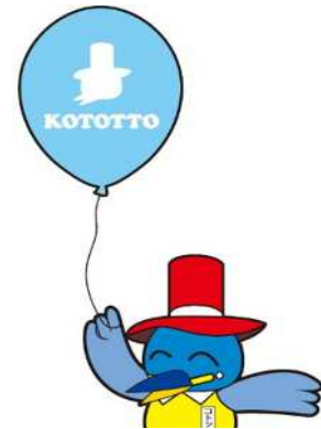
江東区民まつりキャラクター

※無償化対象期間は当該児童の無償化対象となる期間であり、支給決定期間とは異なりますので、ご注意ください。